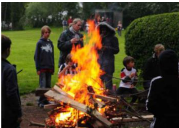
Bålbrenning: På campingplassen i Sør-London er det god stemning for hele familien når bålet tennes om kvelden.