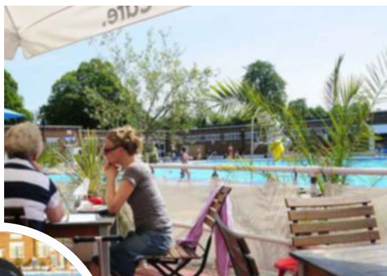
Ved vannkanten: Prisbelønte The Lido Café er hyppig besøkt av lokalbefolkningen.

Brockwell Lido som også blir kalt Brixton Beach. Anlegget, som er bygget i art deco-stil og olympisk størrelse, har vært et populært sted i sommervarmen for innbyggerne i Sør-London helt siden dørene åpnet for første gang i 1937.